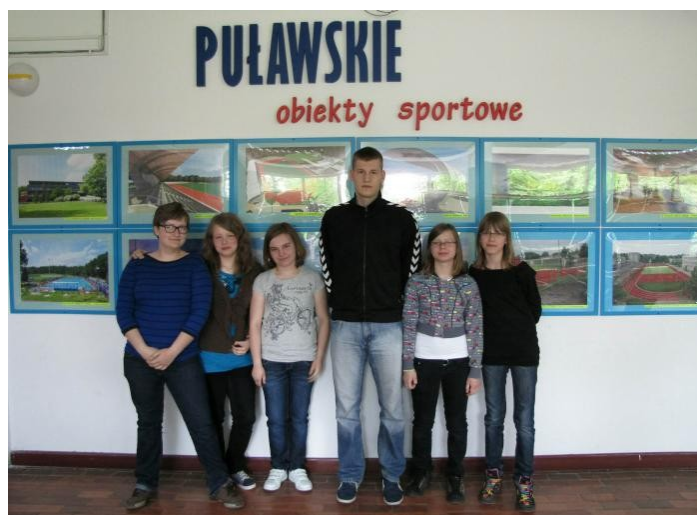
Z bohaterem naszego wywiadu w puławskiej hali MOSiR, gdzie rozgrywane są mecze klubu Azoty Puławy.

To była czwarta klasa podstawówki, ale najpierw nie grałem na pozycji bramkarza, lecz na pozycji rozgrywającego. Dopiero po trzech latach przeszedłem na tę pozycję. Sam bardzo chciałem grać na bramce, ale trenerzy długo nie pozwalali mi na to, bo dobrze radziłem sobie w polu. Wreszcie trafiłem do bramki i myślę, że dobrze na tym wyszedłem.